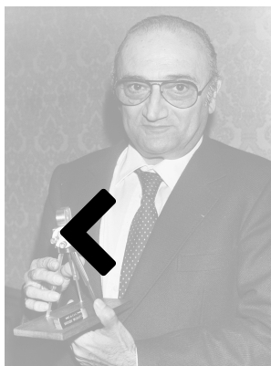
( https://achac.com/artistes-de-france/?p=3079 )